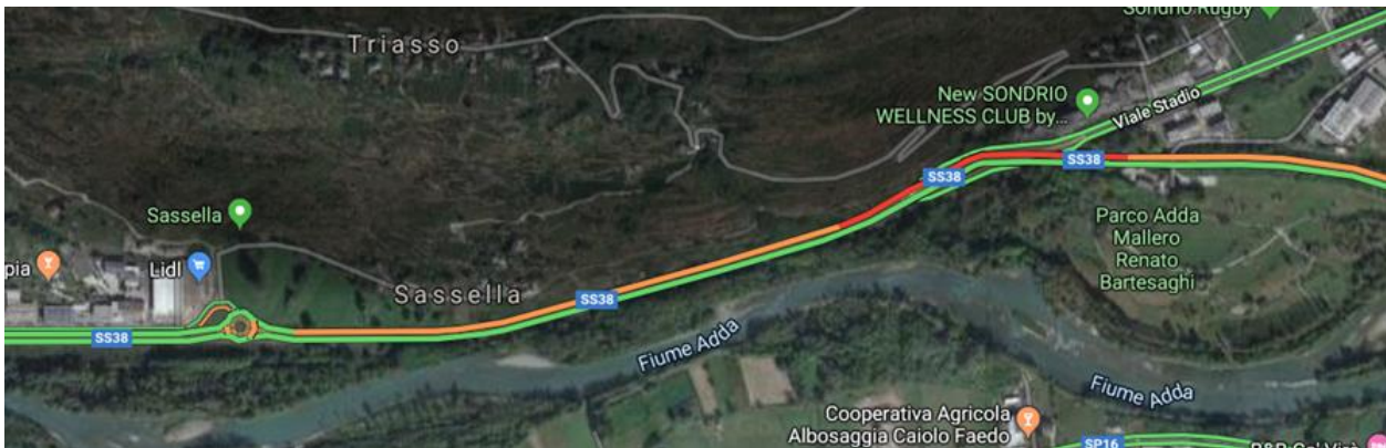
Traffico tipico : DOMENICA SERA

I fenomeni di accodamento e congestione, causati dalla rotatoria "della Sassella", si propagano fino ad interessare lo svincolo e la tangenziale di Sondrio