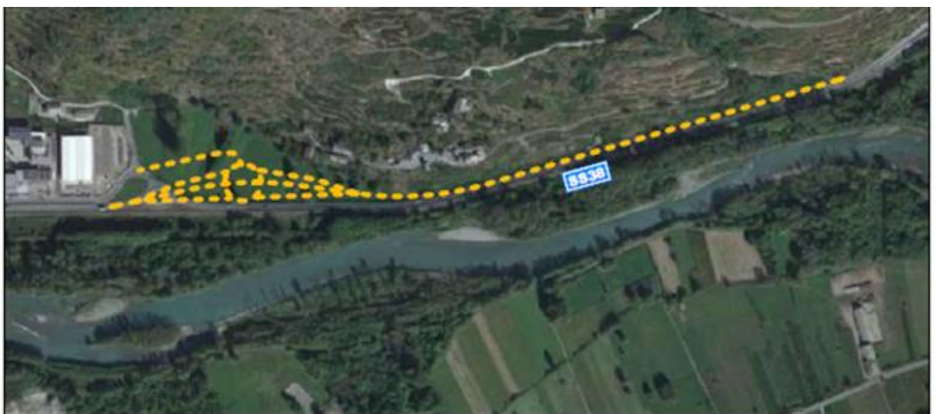
INTERVENTO SU ORTOFOTO

In prima battuta, si propone uno schema di intersezione di tipo "rotatoria a due livelli", con la possibilità di realizzazione della nuova rotatoria e dell'opera di scavalco fuori sede, limitando così al minimo l'interferenza con la viabilità attuale nelle fasi di cantierizzazione.